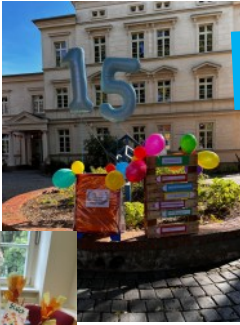
Musicalaufführung „Jona und der Wal“